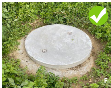
Abb. 3 (A) defekter Schachtdeckel eines Schachtes ohne Entwässerungsfunktion (Quelle: Kt. TG), (B), Offener Schachtdeckel eines Entwässerungsschachtes ohne Pufferzone (Quelle: Merkblatt Schachtdeckel Kt. SO), (C) Intakter Schachtdeckel, jedoch mit fehlerhafter wasserdurchlässiger Einfassung (Quelle: AWEL Kt. Zürich), (D) Belüftungsschacht auf Feldniveau ohne Pufferstreifen (Quelle: AWEL Kt. Zürich), (E) Geschlossener Schachtdeckel mit Pickelloch (Quelle: Merkblatt Schachtdeckel Kt. SO), (F) Aufgesetzter, voll befahrbarer Schachtdeckel aus Beton (Quelle: Kt. TG).

Gemäss Weisung des Bundesamts für Lebensmittelsicherheit und Veterinärwesen (BLV) gelten gegenüber Oberflächengewässern produktspezifische Anwendungsaufgaben zu Reduktion der direkten Abschwemmung. Ob diese analog zu den Oberflächengewässern auch gegenüber nicht verschliessbaren Entwässerungs- und Belüftungsschächten zur Reduktion der indirekten Abschwemmung zu berücksichtigen sind, entscheidet die jeweilige kantonalen Fachstelle.