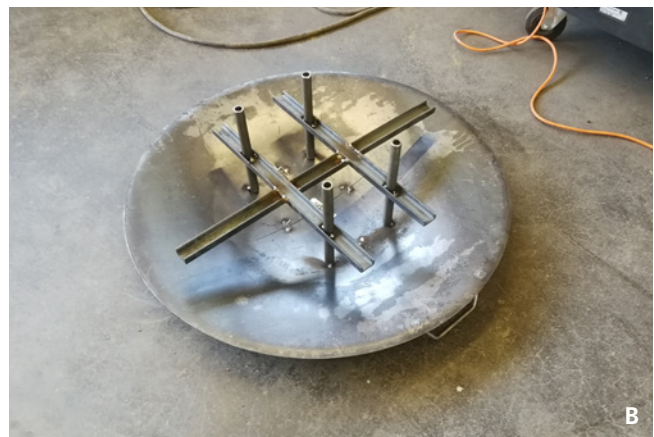
Abb. 1 Modell-Entwurf der HAFL einer Metallabdeckung für offene Einlaufschächte zum Schutz vor Einträgen von Pflanzenschutzmittel in Gewässer durch Abdrift während des Applikationsvorgangs. (A) Ein Überlagern des Metalldeckelrands bei den Schachtdeckeln gewährleistet einen optimalen Schutz im Feld. (B) Metallstifte sorgen für eine gute Verankerung und einen ausreichenden Abstand zum Boden. (Quelle: HAFL).