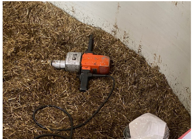
Un manque de compactage peut entraîner une mauvaise fermentation. En cas de problème, l'Association d'ensilage fournit des sondes de silo. Contact : https://www.silovereinigung.ch/angebot/ (en allemand)