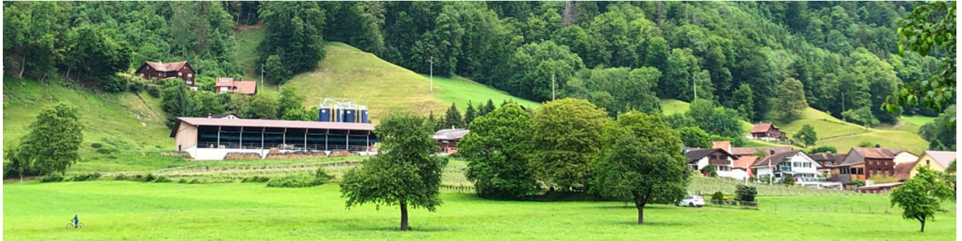
Les installations de silos devraient s'intégrer au mieux dans le paysage et le bâti.

la phase d'avant-projet une demande préalable à l'autorité compétente en matière de construction. En ce qui concerne le site, il s'agit notamment de démontrer de manière compréhensible quelles sont les exigences logistiques pour le remplissage et le désilage et de faciliter ainsi la réalisation du projet.