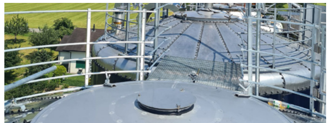
Outre les garde-corps et les protections contre les chutes près de l'ouverture de remplissage, des passerelles suffisamment larges et antidérapantes sur les silos-tours augmentent la sécurité lors du travail