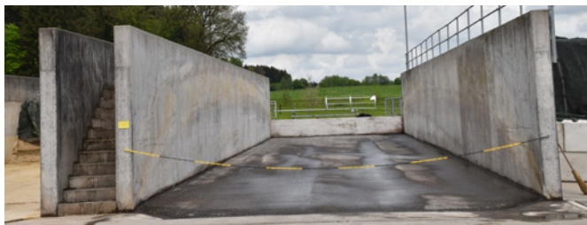
Les accidents dus aux chutes peuvent être évités dans les silos couloir grâce à des garde-corps et/ou des parapets. Un couloir d'au moins 1 m de large entre deux silos permet de créer un accès sûr pour les travaux de bâchage

dans l'agriculture (2018). Lien : Gaz et substances dangereuses dans l'agriculture (bul.ch) . Elles sont complétées par des indications spécifiques sur « Travailler en sécurité sur un silo-tour » (2022). Lien : Travailler en sécurité sur un silo-tour (bul.ch)