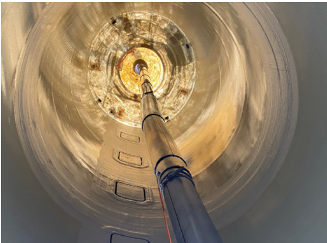
Agir en amont : Les préparatifs des silos-tours pour l'ensilage comprennent le nettoyage continu des parois du silo-tour et des joints des trappes.