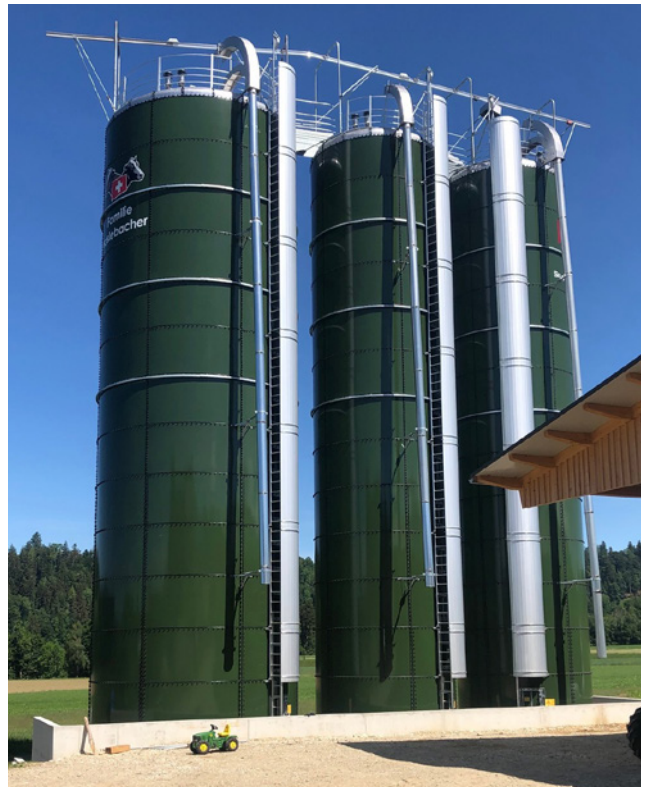
Le choix de l'emplacement, la conception et le dimensionnement du silo sont déterminants pour une utilisation optimale de l'installation. Les voies d'accès pour les véhicules, les travaux de bâchage ainsi que l'utilisation de dispositifs de désilage en font également partie (photo de gauche : Fübbeker ; à droite système de Silo GB)