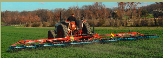
Abb. 1 : Hackstriegel mit grosser Arbeitsbreite

A Beim Vollverzicht auf Herbizide dürfen auf 100 Prozent der angemeldeten Fläche keine Herbizide eingesetzt werden.