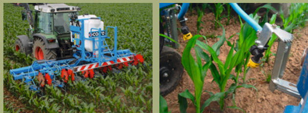
Abb. 2 : Kombiniertes System zum Spritzen in den Reihen und Hacken zwischen den Reihen

B Beim Teilverzicht auf Herbizide dürfen zwischen den Reihen keine Herbizide eingesetzt werden. Die Bandbehandlung darf auf maximal 50 Prozent der Fläche der Parzelle oder der Kultur erfolgen und muss in den Reihen ausgebracht werden. Einzelstockbehandlungen sind nicht zugelassen.