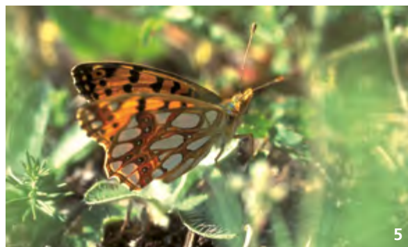
La pensée de Kitaibel (4) nourrit les chenilles du Petit Nacré (5).