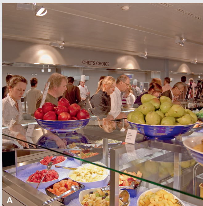
Mensa in Kantonsschule, Foto: SV Group

Die Beschaffung von lokalen Produkten in der Gemeinschaftsgastronomie bietet eine grosse Chance für die Erhaltung und Förderung der lokalen Landwirtschaft und Wertschöpfungsketten. Wie kann eine funktionierende Kommunikation und Koordination zwischen den ProduzentInnen, LogistikerInnen, AuftraggeberInnen und Küchenchefs aufgebaut werden?