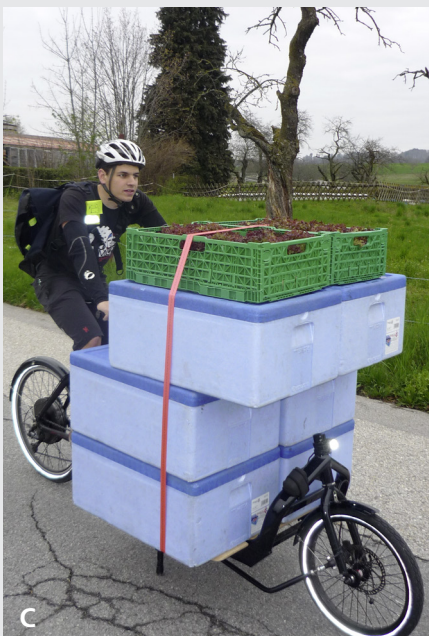
Lieferung der Plateforme Bio Lausanne

Die „Plattform Bio Lausanne“ ist eine Genossenschaft. Sie wurde im 2013 gegründet und zählt 15 ProduzentInnen sowie die Stadt Lausanne als Mitglieder, die auch die Parteien der Kooperative ausmachen. Um GenosschafterIn zu werden, verpflichten sich die Mitglieder, im Minimum Waren im Wert von 1'000 CHF zu liefern oder zu beziehen. Die Plattform beliefert fünfzehn Institutionen (Kinderhorte, Restaurants und Läden) der Stadt Lausanne mit biologischen und lokalen Produkten; je nach Verfügbarkeit auch Produkte des Labels BioSuisse oder lokale IP-Produkte. Ein fest angestellter Lieferant sowie temporär eingesetzte StudentInnen beliefern die Kunden mit dem Velo – rund 2 bis 3 Stunden täglich. Drei Personen sind in der Küche angestellt. Der entscheidende Akteur, der ermöglicht hat lokale ProduzentInnen zu finden, ist Bio-Vaud. An der Generalversammlung im Jahr 2011 konnte der Gründer von Plateforme Bio die Genossenschaft und das Konzept dahinter vorstellen. Alle zwei Tage werden die Produkte bei den ProduzentInnen per Lieferwagen abgeholt. Krippen werden per Fahrrad beliefert.