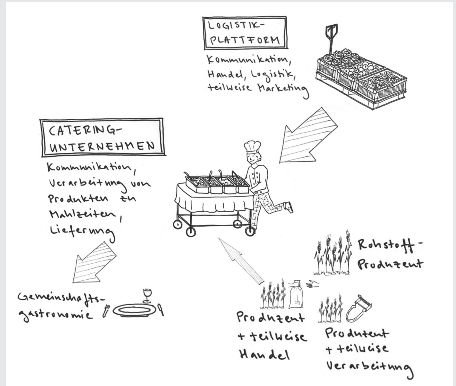
Bildlegende: Catering-Unternehmen: Zubereitung von Mahlzeiten, Lieferung an Gemeinschaftsgastronomiebetriebe

Als Catering-Unternehmen werden Dienstleister bezeichnet, die Produkte hauptsächlich von Logistik-Plattformen oder teilweise direkt von ProduzentInnen beziehen und diese zu halb fertigen oder fertigen Mahlzeiten verarbeiten. Die Lieferung erfolgt per kalte oder warme Linie zu den jeweiligen Gastronomieunternehmen. Interessant für ProduzentInnen aus der Region sind Catering-Unternehmen, welche sich auf die Beschaffung und Verarbeitung von regionalen Produkten spezialisiert haben und Partnerschaften mit Gastrobetrieben eingehen, welche explizit ein regionales Angebot führen.