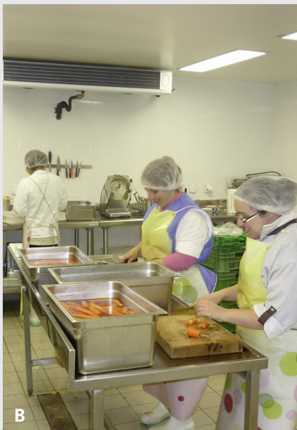
Verarbeitung zu Convenience-Produkten bei Plateforme Bio Lausanne

Durch regelmässige Ausschreibungen für die Beschaffung von Produkten seitens der öffentlichen Ämter entsteht ein Preisdruck, da günstige Angebote ein wesentliches Auswahlkriterium sind. Eine sinnvolle Strategie in der Zusammenarbeit ist die gemeinsame Ausarbeitung einer Klausel für das Auswahlverfahren, welche die Beschaffung von lokalen Produkten fördert.