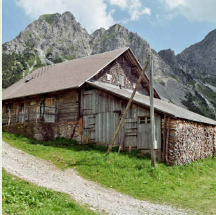
Alp Jänzimatt, Gilgenhütte, Obwalden