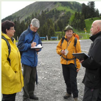
Instruktionen auf der Testwanderung