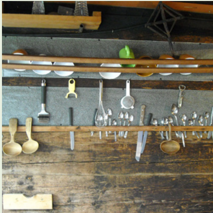
Alp Jänzimatt, Herrenhütte, Innenansicht