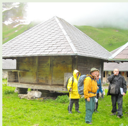
Testwanderung mit den Wanderleitern

Dabei sind u. a. zu berücksichtigen (siehe Tabelle 1):