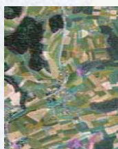
Vernetzung in der Agglomeration

Als Hintergrund wurden symbolhaft Landschaften ausgewählt, anhand deren Sie erkennen können, ob es sich um ein Projekt in der Agglomeration, im Tal-, Hügel- oder Berggebiet handelt.