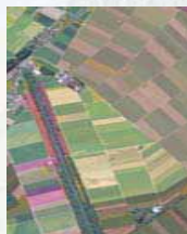
Vernetzung im Talgebiet