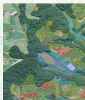
Vernetzung im Hügelgebiet