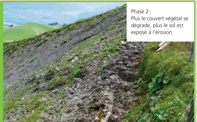
Phase 2 : Plus le couvert végétal se dégrade, plus le sol est exposé à l'érosion.