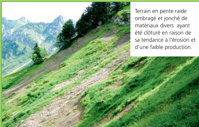
Terrain en pente raide ombragé et jonché de matériaux divers ayant été clôturé en raison de sa tendance à l'érosion et d'une faible production.

L'interdiction de pâture de ces surfaces est justifiée par la menace de disparition des espèces et par le risque d'érosion de ces surfaces.