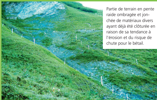
Partie de terrain en pente raide ombragée et jonchée de matériaux divers ayant déjà été clôturée en raison de sa tendance à l'érosion et du risque de chute pour le bétail.