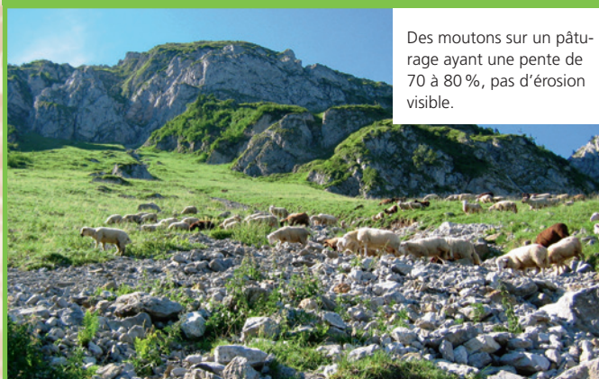
Des moutons sur un pâturage ayant une pente de 70 à 80 %, pas d'érosion visible.