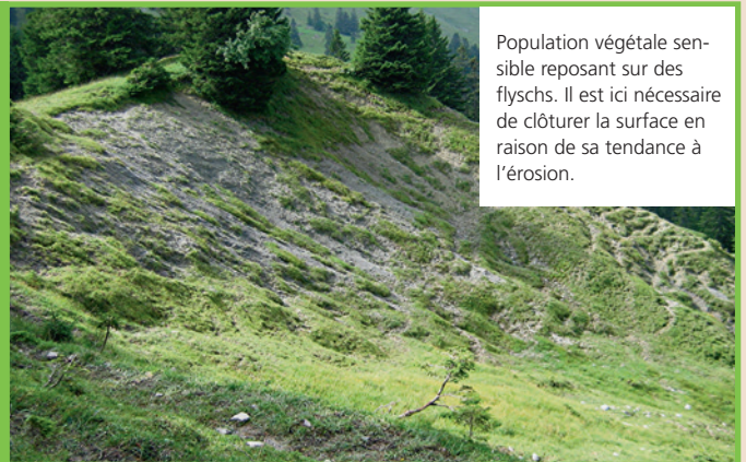
Population végétale sensible reposant sur des flyschs. Il est ici nécessaire de clôturer la surface en raison de sa tendance à l'érosion.