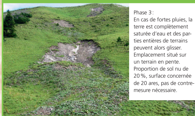
Phase 3 : En cas de fortes pluies, la terre est complètement saturée d'eau et des par- ties entières de terrains peuvent alors glisser. Emplacement situé sur un terrain en pente. Proportion de sol nu de 20 %, surface concernée de 20 ares, pas de contre- mesure nécessaire.