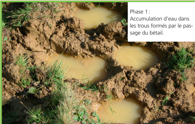
Phase 1 : Accumulation d'eau dans les trous formés par le pas- sage du bétail.

Ces chemins ne glissent tout d'abord qu'en certains endroits et de façon limitée. Phase 2 : Au fil des années, c'est-à-dire après une période de 3 à 5 ans, le nombre et l'ampleur des glissements augmentent. Plus le couvert végétal se dégrade, plus le sol se voit exposé à l'érosion et plus le système racinaire s'affaiblit. Tout le terrain en pente peut devenir instable. Phase 3 : En cas de fortes pluies, la terre sera complètement saturée d'eau et des terrains entiers peuvent alors glisser sous l'effet de la gravité.