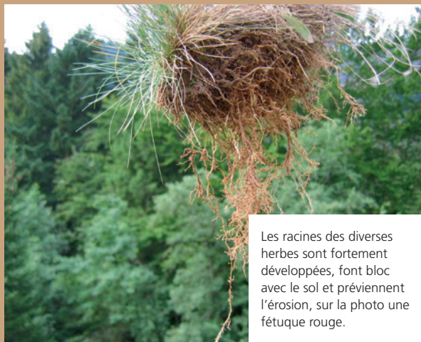
Les racines des diverses herbes sont fortement développées, font bloc avec le sol et préviennent l'érosion, sur la photo une fétuque rouge.

Les alpages sujets à l'érosion et en forte pente ne doivent pas être fertilisés avec du lisier. À cause de la teneur élevée en azote du lisier, les herbes forment moins de racines et celles-ci font moins bloc avec le sol. C'est la raison pour laquelle il est préférable d'épandre du fumier sur ces surfaces.