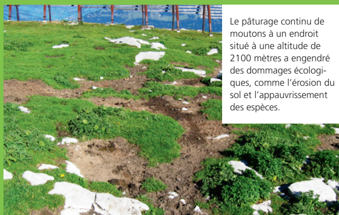
Le pâturage continu de moutons à un endroit situé à une altitude de 2100 mètres a engendré des dommages écologiques, comme l'érosion du sol et l'appauvrissement des espèces.