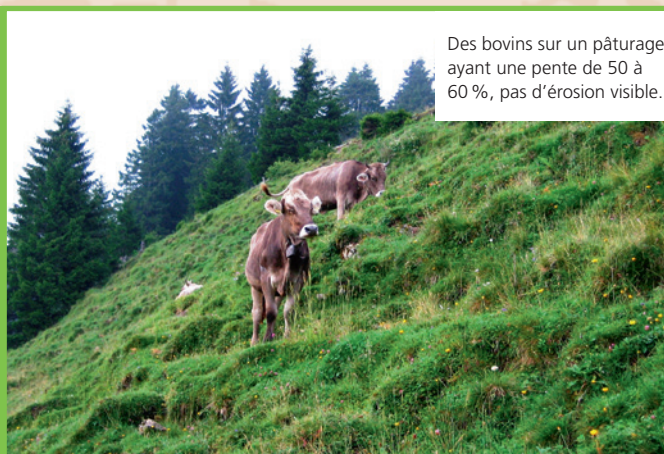
Des bovins sur un pâturage ayant une pente de 50 à 60 %, pas d'érosion visible.