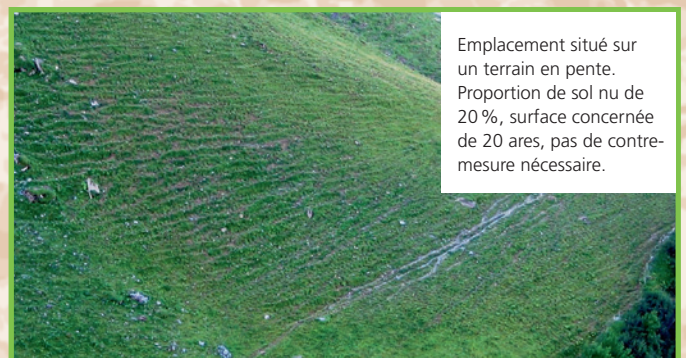
Emplacement situé sur un terrain en pente. Proportion de sol nu de 20 %, surface concernée de 20 ares, pas de contre- mesure nécessaire.

Dans la mesure où des dommages liés à l'érosion (proportion de sol nu comprise entre 30 % et 50 %) s'étendent sur une surface de moins de 30 ares par emplacement ou par terrain en pente, aucune contre-mesure ne doit alors être prise. Il est toutefois judicieux de prendre connaissance des 10 règles exposées à la page 5.